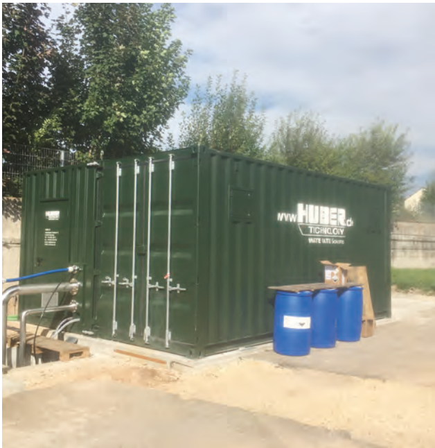
HUBER Anlagentechnik in Containerbauweise – Flotationen oder Schlammwässerungen ohne Bauarbeiten – sofort einsatzbereit.