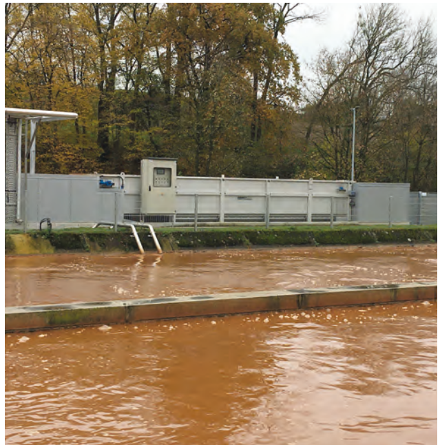
HUBER Druckentspannungsflotationen zur Schlammabscheidung und Ablaufbehandlung – die Lösung zur Ertüchtigung überlasteter Abwasseranlagen.