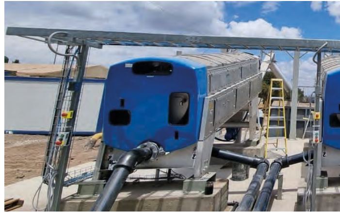
HUBER Schneckenpressen zur Schlammbehandlung – beste Umwelt- und Entsorgungskosten.