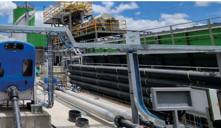
wässerungsleistung und höchste Volumenreduktion zur Senkung der