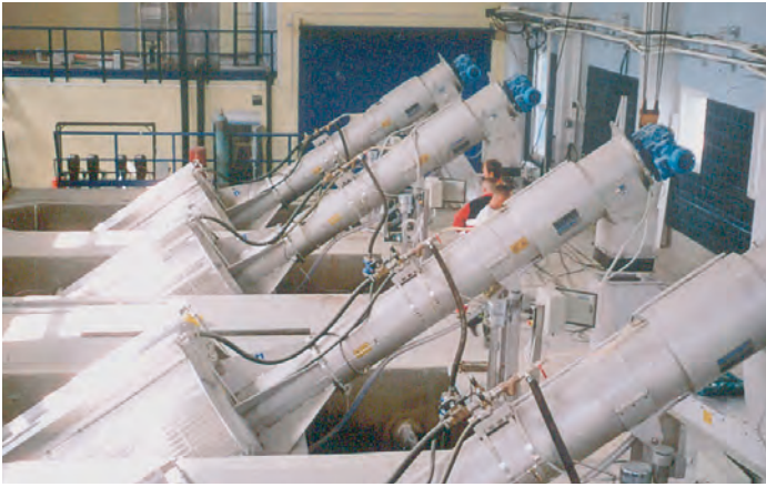
HUBER Rechen- und Siebsysteme zur mechanischen Vorreinigung - effizient, langlebig und vielfach erprobt.