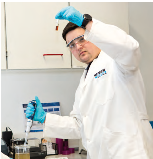
Voruntersuchungen im Labor oder direkt vor Ort zur Ermittlung der Betriebsparameter und Ablaufwerte - Sicherheit für Kunden und Betreiber.