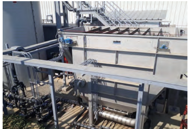
HUBER Druckentspannungsflotation zur physikalisch-chemischen Vorreinigung - optimale Reduktion von CSB, Fetten und Feststoffen, mehr als 500 Installationen weltweit.