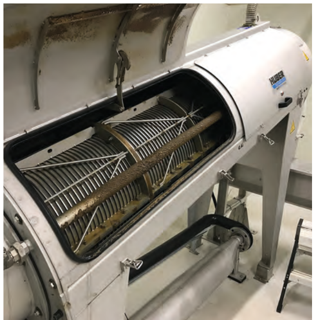
HUBER Schneckenpresse zur Entwässerung von Restschlamm aus OnShore-Fischfarmen (Lachsproduktion) - Reduktion der Entsorgungskosten.