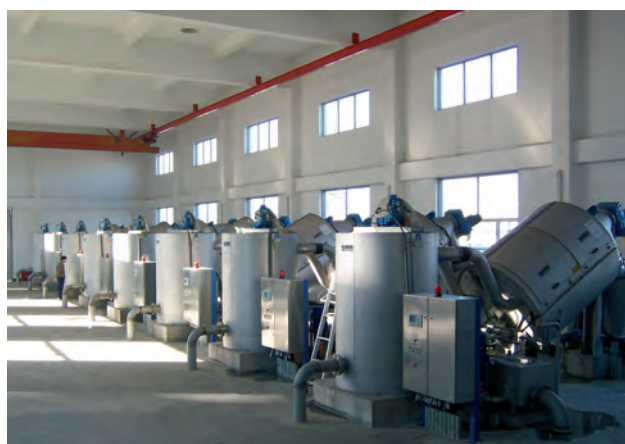
Восемь шнековых сгустителей, рассчитанных на поступающий объем 600 м 3 /ч