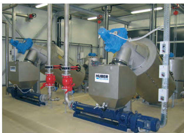
Два шнековых сгустителя HUBER S-DRUM, рассчитанных на поступающий объем 80 м 3 /ч