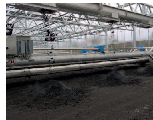
Automatisierte Aufgabe des Schlammes

Alle Teilnehmer treffen sich vor der Abfahrt am HUBER-Messestand. Fragen Sie unsere Damen an der Informationstheke nach dem Treffpunkt. Jeder Teilnehmer erhält ein Lunchpaket.