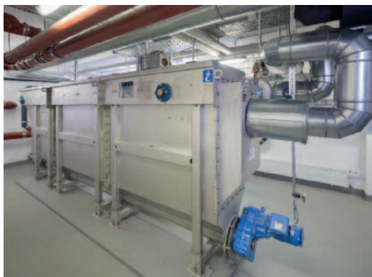
HUBER Abwasserwärmetauscher RoWin im Klinikum rechts der Isar