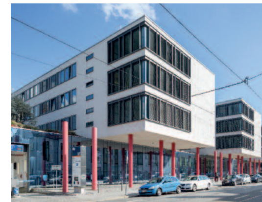
Klinikum rechts der Isar

Nutzen Sie die Chance zur Besichtigung eines innovativen Konzepts zur Energie- und CO 2 -Einsparung im Klinikum r.d. Isar und sehen Sie, welches Potential auch in Ihrer Anlage stecken könnte!