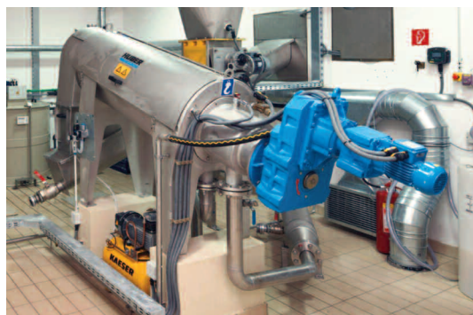
HUBER Schneckenpresse zur Entwässerung von Prozessschlamm