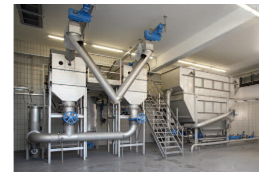
HUBER Komplettsysteme zur Abwasserbehandlung in der Industrie