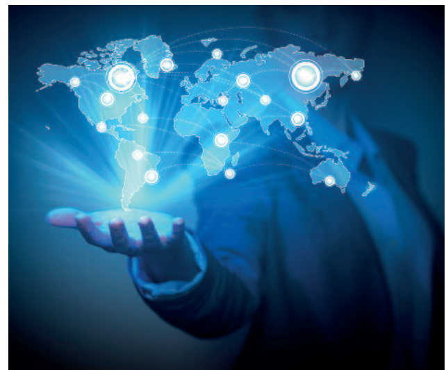
HUBER HOC-System - Ihr virtueller Serviceberater