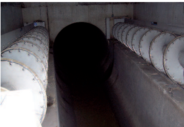
Ausrüstung eines beidseitigen Überlaufes mit HUBER Siebanlagen ROTAMAT® RoK1 60°