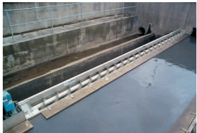
HUBER Siebanlage ROTAMAT® RoK1 an einem Abschlagsbauwerk