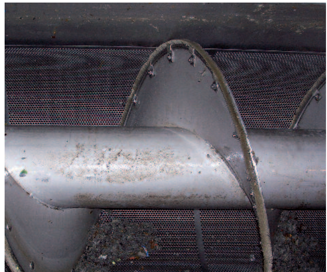
Siebgutschonende Zwangsreinigung der radialen Siebfläche