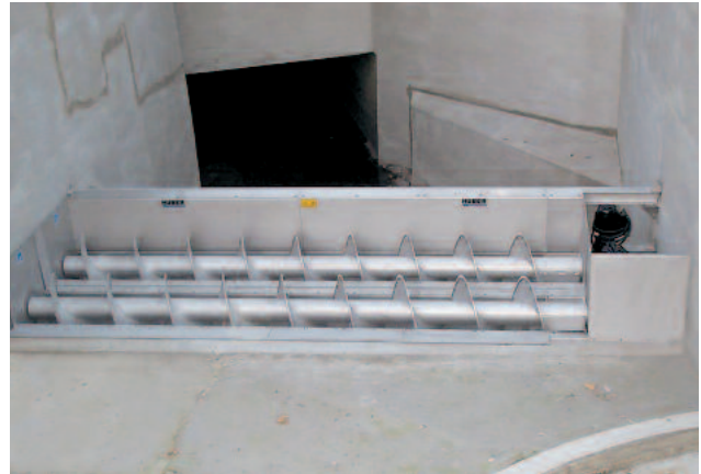
Kombination von 2 HUBER Siebanlagen ROTAMAT® RoK1 für große Entlastungsmengen