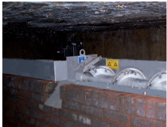
Standardmäßige Siebgutrückführung in den Abwasserkanal mit einer Auswerferklappe