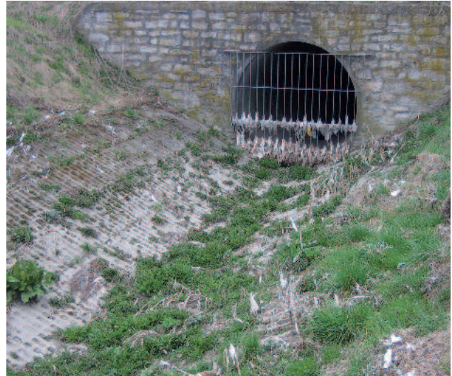
Typisches Bild eines Regenauslassbauwerkes ohne Grobstoffrückhalt nach einem Entlastungsereignis

Die Siebanlage ist unmittelbar nach der Überlaufschwelle des Entlastungsbauwerkes horizontal angeordnet und besteht aus einer 180° gewölbten Siebfläche mit integrierter Schneckenwendel. Für die Dauer eines Entlastungsereignisses wird die Siebanlage von oben nach unten durchströmt und die Feststoffe zurückgehalten. Diese werden durch eine Schneckenwendel mit Bürstenbesatz während der automatischen Zwangsreinigung der Siebfläche verpressungsfrei und schonend zur seitlichen Auswurfvorrichtung transportiert und in den weiterführenden Abwasserstrom zurückgeführt. Alternativ kann das Rechengut mit einer Förderpumpe aus der Siebanlage abgezogen und an einen weiteren Entsorgungspunkt gefördert werden. Während des Entlastungsereignisses aktiviert sich die Siebanlage selbstständig und arbeitet vollautomatisch.