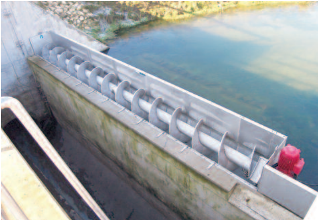
HUBER Siebanlage ROTAMAT® RoK1 an einer Entlastungsschwelle

Überzeugen Sie sich von der HUBER Siebanlage ROTAMAT® RoK1 anhand der untenstehenden Anwendungsbeispiele.