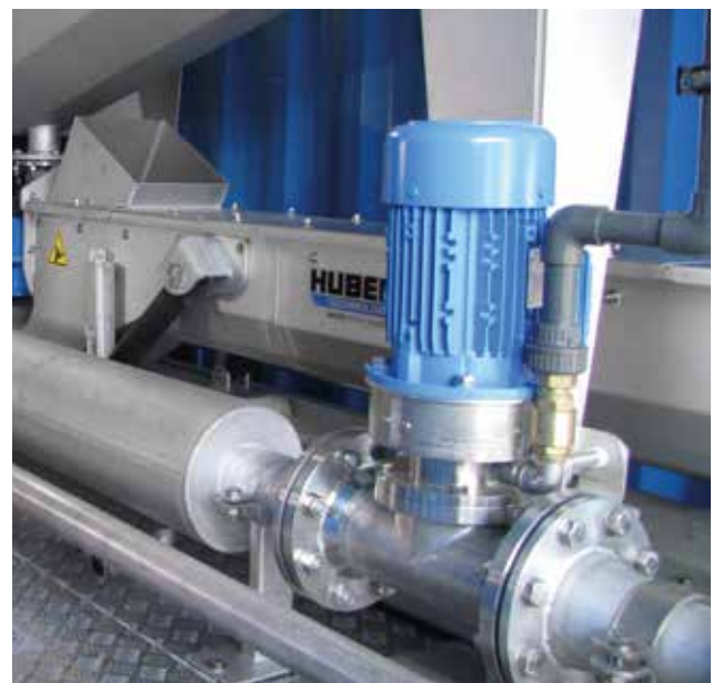
IPM 100 installiert vor Schlammentwässerung.