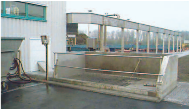
Annahmebunker mit Stabrost und integrierter vertikaler Dosierschnecke