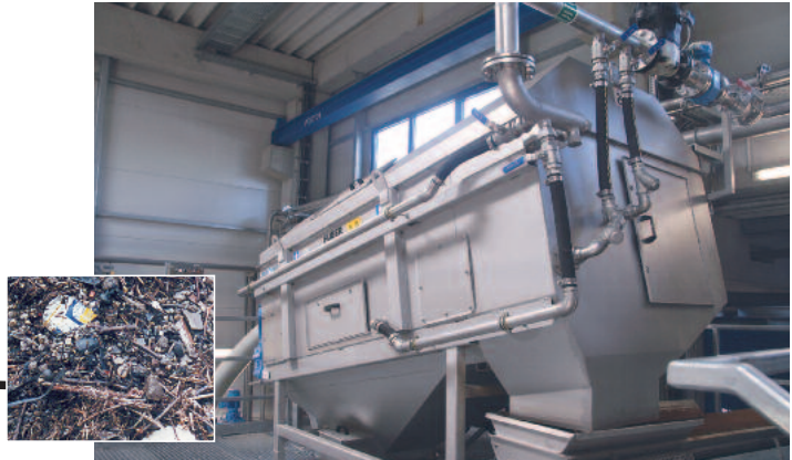
Auswaschen und Abtrennen aller Grobstoffe > 10 mm mit der HUBER Waschtrommel RoSF9