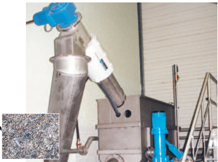
Absieben bei 1 mm und Entwässern (TR ca. 30%) der organischen Stoffe mit der HUBER Siebanlage ROTAMAT®.