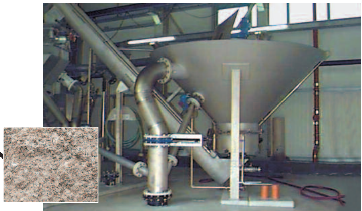
Gewaschener Sand aus der HUBER Coanda Sandwaschanlage RoSF4 mit GV < 3%, Korngröße bis 10mm, TR > 90%