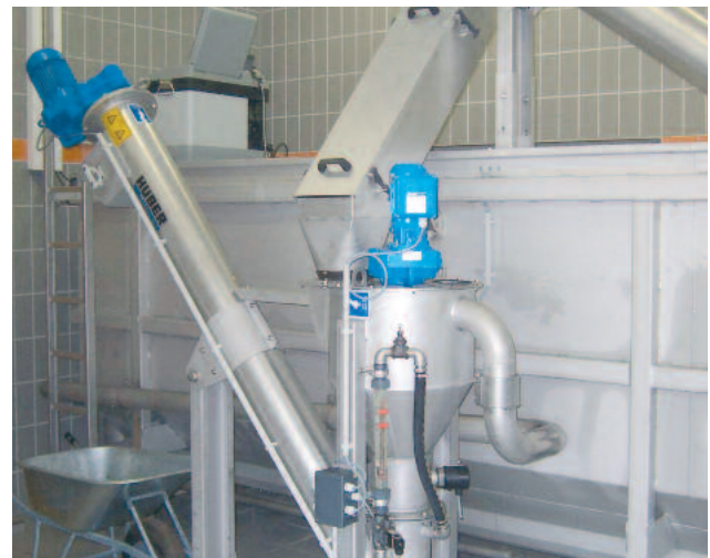
Kleine HUBER Sandwaschanlage RoSF4 TC wäscht klassierten Sand aus einer HUBER Kompaktanlage ROTAMAT® Ro5