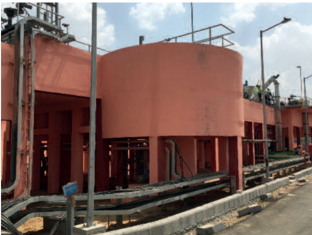
HUBER Rundsandfang VORMAX Installation mit HUBER Coanda Sandwaschanlage RoSF4