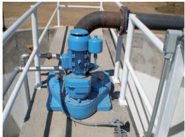
Robuster Bull Gear Antrieb für das Rührwerk mit Druckluftheber