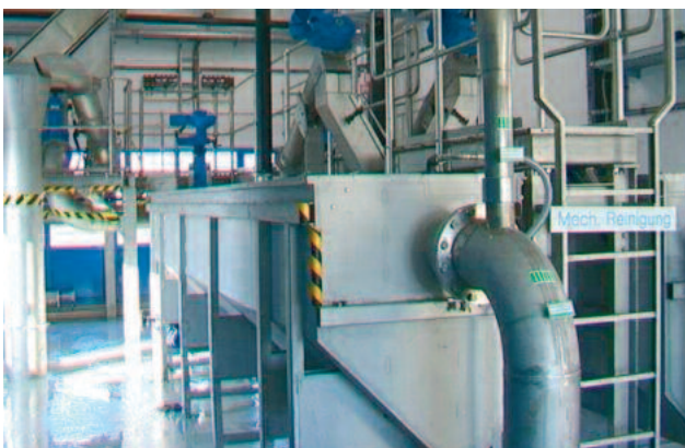
Oberirdische, redundante HUBER Langsandfänge ROTAMAT® Ro6