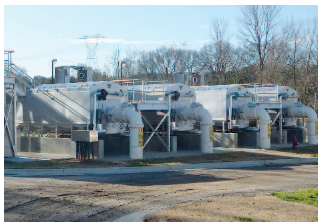
4 HUBER Scheibenfilter RoDisc® mit 18 Scheiben im Edelstahlbehälter