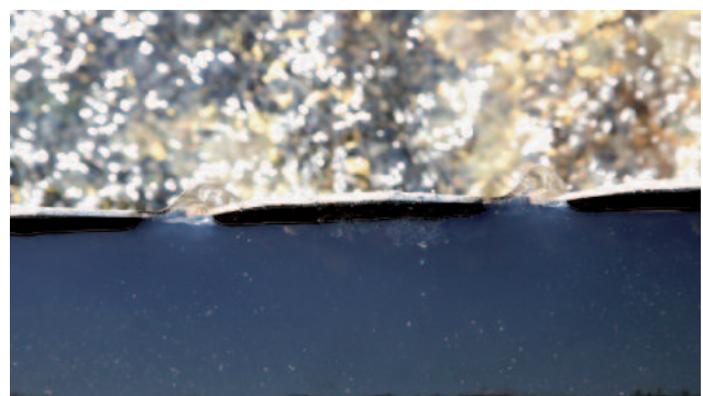
Belebtschlammflocken können im Nachklärbecken oft nicht ausreichend zurückgehalten werden