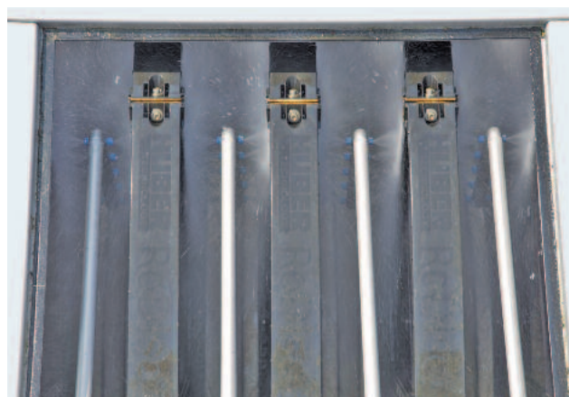
Rückspülung der Scheiben erfolgt mittels Filtrat – keine externe Wasserzufuhr notwendig