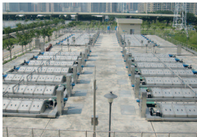
28 HUBER Scheibenfilter RoDisc® mit jeweils 24 Scheiben reinigen knapp 8,5 m 3 Abwasser pro Sekunde