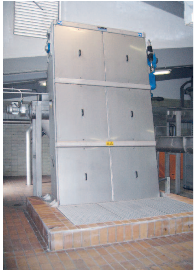
Der HUBER Harken-Umlaufrechen RakeMax®-hf ist von außen nicht von der bewährten Basismaschine RakeMax® zu unterscheiden.