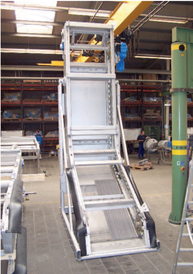
HUBER Rake-Max®-hf vor der Auslieferung im Werk zeigt deutlich den flachen und daher hydraulisch günstigen Siebabschnitt