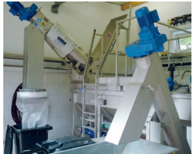
Kompaktanlage mit integriertem Sandwäscher