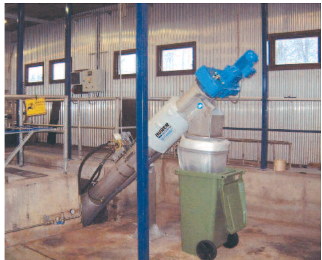
Gerinneeinbau der HUBER Siebschnecke ROTAMAT® Ro9 – Baugröße 700