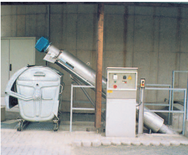
HUBER Siebschnecke ROTAMAT® Ro9 in Freiluftaufstellung