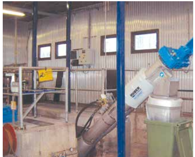
Gerinneeinbau der HUBER Siebschnecke ROTAMAT® Ro9 – Baugröße 700.