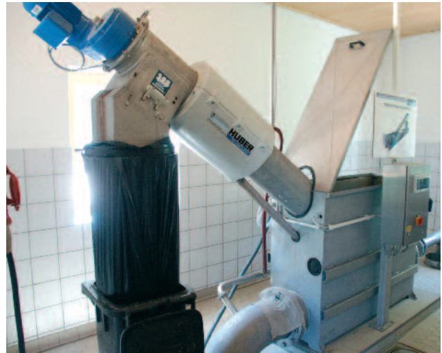
Behälterausführung der HUBER Siebschnecke ROTAMAT® Ro9