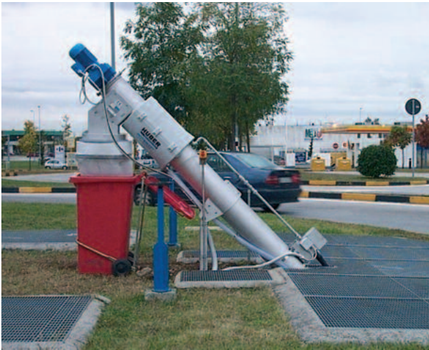
HUBER Siebschnecke ROTAMAT® Ro9 inmitten eines Kreisverkehrs