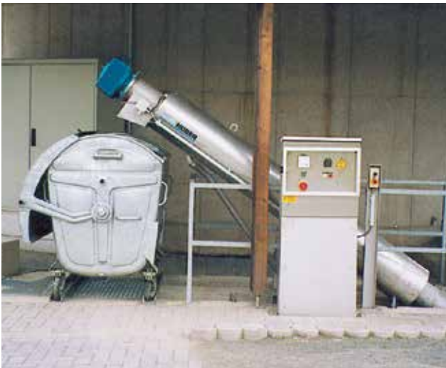
HUBER Siebschnecke ROTAMAT® Ro9 in Freiluftaufstellung.