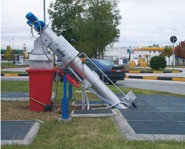
HUBER Siebschnecke ROTAMAT® Ro9 inmitten eines Kreisverkehrs.