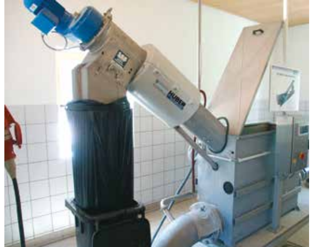
Behälterausführung der HUBER Siebschnecke ROTAMAT® Ro9.