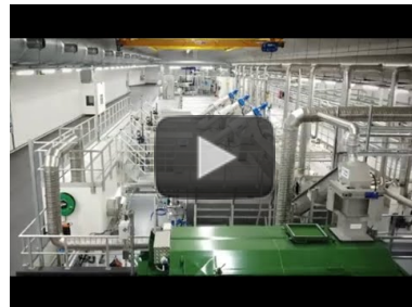
Video: Komplette Abwasserbehandlung auf der Kläranlage Øygarden in Norwegen https://www.youtube.com/watch?v=fcd8KDhYoL8