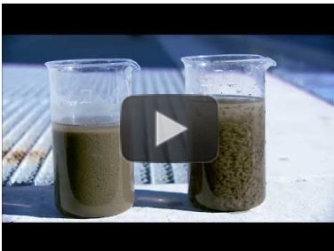
Video: HUBER Scheibeneindicker S-DISC - hier auf der kommunalen Kläranlage Straubing https://www.youtube.com/watch?v=IIWRSRjf13g