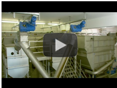
Video: HUBER Disc Thickener S-DISC zur Überschussschlammeindickung in der fleischverarbeitenden Industrie https://www.youtube.com/watch?v=Hr4tqa2yKqc