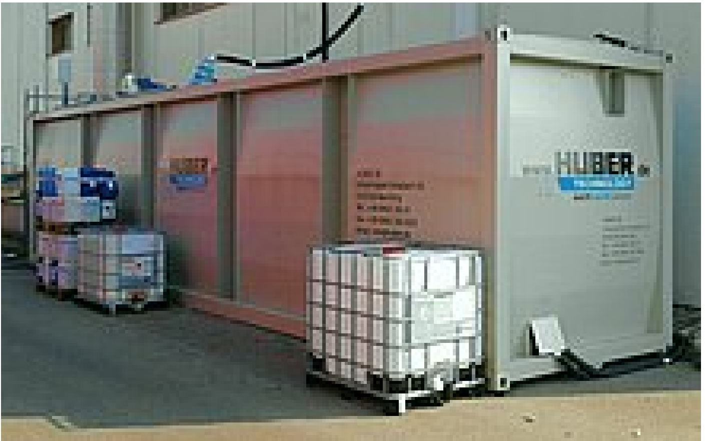
Versuchsanlage in Container-Bauweise

Im Jahre 2008 wurden weltweit 1.816,6 Mio. hl Bier produziert. Ein durchschnittlicher Frischwassereinsatz von 400 Litern je hl Bier bedeutet, dass dementsprechend 726,6 Mio. m 3 an Frischwasser bereitgestellt werden müssen. Etwa ein Drittel des eingesetzten Wassers könnte jedoch durch Brauchwasser ersetzt werden, das in dafür geeigneten Produktionsbereichen nicht den höchsten Anforderungen der Trinkwasserverordnung entsprechen muss. Das daraus resultierende Einsparpotential von ca. 240 Mio. m 3 erfordert teilweise neue Verfahren, um dieses zu erschließen.