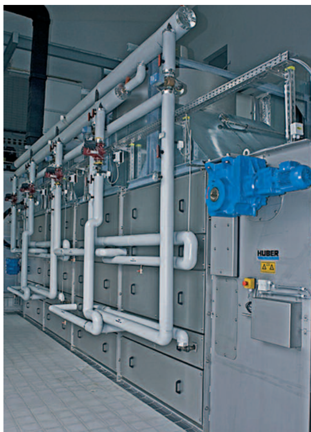
Wärmeversorgung eines Bandrockners durch Biogasabwärme

Die mechanische Entwässerung von Klärschlamm stellt die günstigste Methode zur Volumenreduzierung dar und war lange Zeit die letzte Behandlungsstufe für Schlamm aus Kläranlagen. Mit dem forcierten Ausstieg einiger Bundesländer aus der landwirtschaftlichen Verwertung und der Novellierung der Klärschlammverordnung durch die EU und die damit verbundenen strengeren Grenzwerte u. a. für Kupfer und Zink wird in Zukunft nur noch die thermische Verwertung als Entsorgungsschiene für Klär-