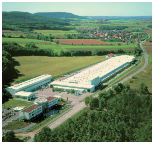
Huber SE maison mère et usine basée à Berching en Allemagne