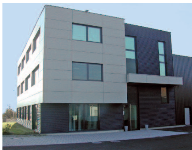
Filiale française de Huber Technology à Barr en Alsace