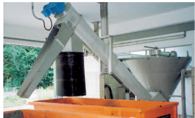
Eine Klassierschnecke transportiert das abgeschiedene Sandfangmaterial aus dem Abscheideraum in den Container.