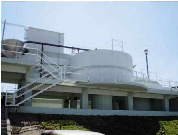
HUBER VORMAX Installation mit COANDA Sandklassierer RoSF 3