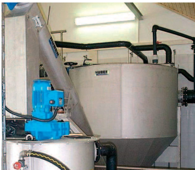
HUBER Rundsandfang mit integrierter Klassierschnecke und nachgeschalteter HUBER Sandwaschanlage RoSF4/t

Der HUBER-Rundsandfang HRSF wurde mit Hilfe numerischer Simulationsrechnungen ausgelegt und ist in Zusammenarbeit mit der Landesgewerbeanstalt (LGA) unter Praxisbedingungen getestet und verifiziert worden.