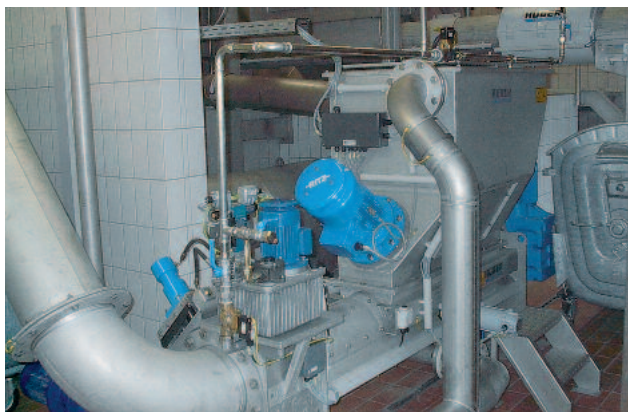
Beste Wasch- und Entwässerungsergebnisse

Nach dem Waschen wird das gewaschene Rechengut in eine, in der Anlage integrierte Presszone gefördert. Dort wird das Rechengut mittels einer robusten Pressschnecke entwässert. In einer anschließenden zweiten, automatisch geregelten Hochdruckpresszone wird das Rechengut auf einen TR-Gehalt von bis zu 60 % entwässert. Besonders verschleißfeste und massive Werkstoffe im Hochdruckbereich garantieren einen langfristigen und sicheren Betrieb der Anlage. Das aus dem Rechengut entweichende Presswasser wird unterhalb des Hochdruckteils gesammelt und gemeinsam mit dem kohlenstoffreichen Washwasser aus der Waschzone abgeleitet. Die Auffangwanne unterhalb der Maschine und das komplette Hochdruckpressteil werden, um Ablagerungen zu vermeiden, automatisch mit Wasser