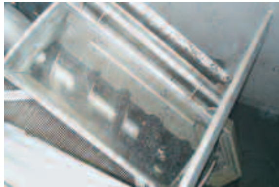
Im Rechenkorb werden Schwimm- und Schwebstoffe effektiv zurückgehalten. Durch die durchgreifenden Rechenzähne erfolgt eine Zwangsreinigung des Rechenkorbes