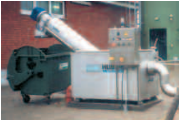
ROTAMAT® Fäkalannahmestation Ro 3.1 mit ROTAMAT® Feinstrechen in beheizter und isolierter Ausführung

Dieser ROTAMAT® Feinstrechen ist äußerst robust, er ist betriebssicher gegen Steine und Sand, ist vollständig aus Edelstahl und hat durch die den Korb durchgreifende Rechenzähne eine vollständige Zwangsreinigung (informieren Sie sich über diesen Rechen aus unserem Prospekt Ro 1).