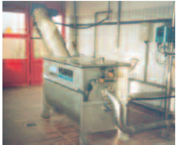
ROTAMAT® Fäkalannahmestation Ro 3.1 mit ROTAMAT® Feinstrechen

Durch die ständig wachsende Anforderung an Personal und Maschine bzw. Anlage, sowie der ständigen Modernisierung von Technik und Software, kommen immer häufiger Systeme mit automatischer Software zur Anwendung. Diese Software erleichtert das Handling zur Erfassung, Speicherung bis hin zur Abrechnung. Verschiedene Anforderungen und unterschiedliche Aufgabenstellungen (je nach Beschaffenheit des Mediums) sind durch dieses Komplettsystem, d.h. inkl. Einleitstrecke, Durchflussmessung und Probenehmer, zu realisieren. Durch das System werden viele Handlingaufgaben in einem Prozess vereinfacht. Anlagen können autark arbeiten und durch den Kunden-/Lieferanten bedient und gestartet werden. Das System ist so konzipiert, dass Daten der Anlage aufgezeichnet (abhängig von der Variante) und gespeichert werden.