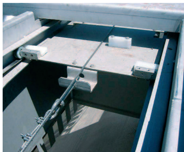
Teilautomatische Fetträumung mittels Fettpaddel