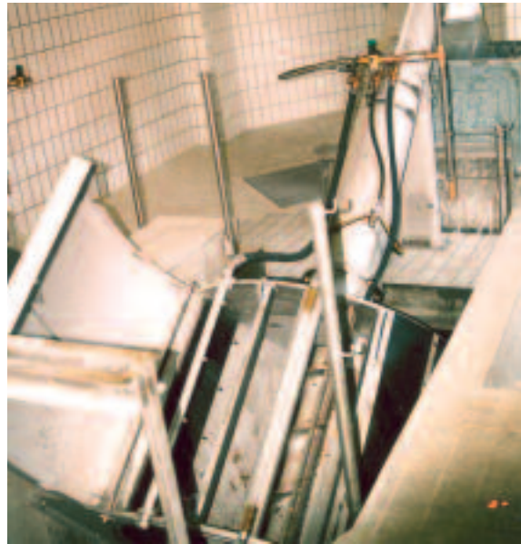
Gerinneeinbau des ROTAMAT® Feinstrechens Ro 1 mit integrierter Rechengutauswaschung IRGA