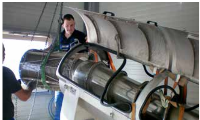
Effiziente und fachgerechte Durchführung.