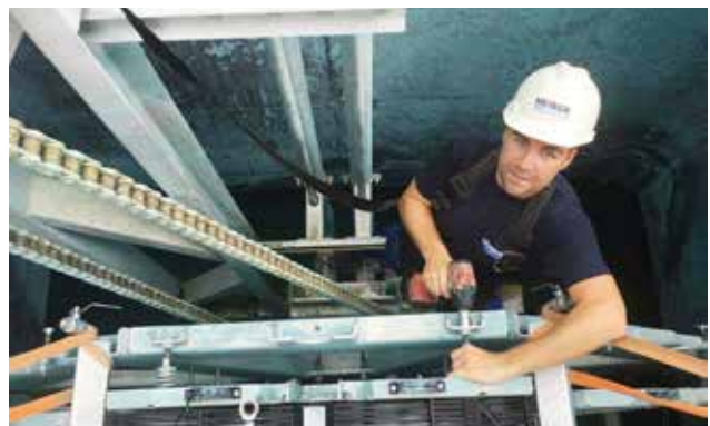
Erfolgreicher Betriebsstart durch fachgerechte Montage.