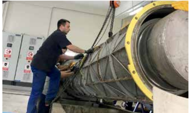
Ressourcen-Nutzung – ganz im Sinne der Nachhaltigkeit.