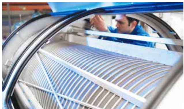
Vollständige Überarbeitung bei uns im HUBER Werk.