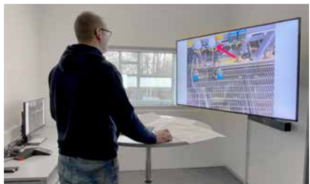
Remote Support – nicht vor Ort, aber trotzdem live dabei.