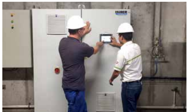
Know-How Transfer zum Betreiberpersonal für optimalen Betrieb der Gesamtanlage.