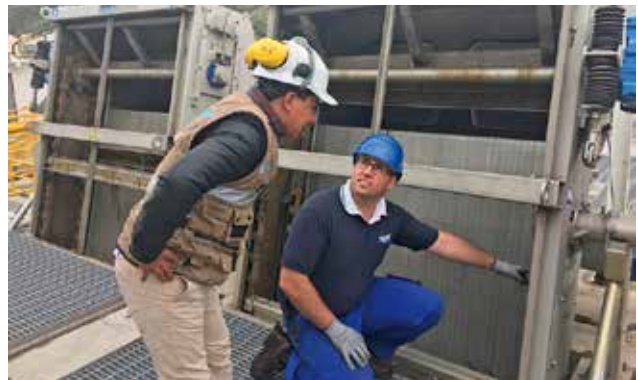
Kundennähe ist unsere höchste Priorität – Beratung vor Ort vom HUBER Experten.