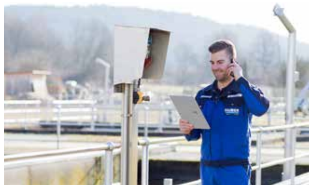
Spezialisten für Sie vor Ort.