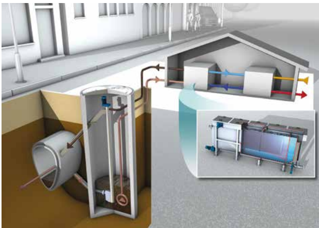
Umweltfreundliche Wärmeversorgung für Gebäude: HUBER ThermWin®-Verfahren mit HUBER Abwasserwärmetauscher RoWin.