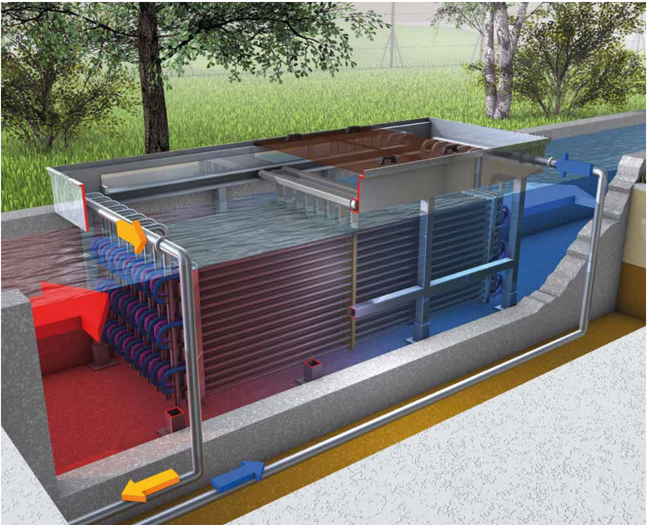
Einsatz des HUBER Abwasserwärmetauschers RoWin C im Betonbecken. Der Wärmeüberträger wird im Freispiegel durchströmt.

solchen Anlage deutlich verbessert. Gerade im Hinblick auf die energetische Sanierung von Kläranlagen kann der HUBER Abwasserwärmetauscher RoWin einen entscheidenden Beitrag leisten. Die kompakte Bauweise und die Aufstellung in einem Gerinne oder einem Becken verursachen keinen zusätzlichen Platzbedarf, womit die örtlichen Verhältnisse bestmöglich ausgenutzt werden. Eine Nutzung des Kläranlagenablaufes schließt eine Biofilmbildung auf den Wärmeübertragerflächen jedoch nicht gänzlich aus. Deshalb stellt die automatisierte Reinigungseinrichtung der Tauscherröhre weiterhin einen zentralen Punkt für eine dauerhafte und maximale Wärmeübertragungsleistung dar. Die Möglichkeit die Wärmetauscher parallel oder in Reihe zu verschalten, eröffnet ideale Anpassungsmöglichkeiten an Becken- und Abwasserhältnisse. Befahrbar abdeckungen ermöglichen einen Einbau der Anlage beispielsweise unter Parkflächen.