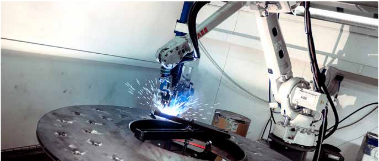
Robotergeschweißte Scheiben stellen gleichbleibend hohe Qualität sicher.

Prozesssichere Kondensatabfuhr aus den Scheiben durch den Verzicht auf ein Siphonrohr