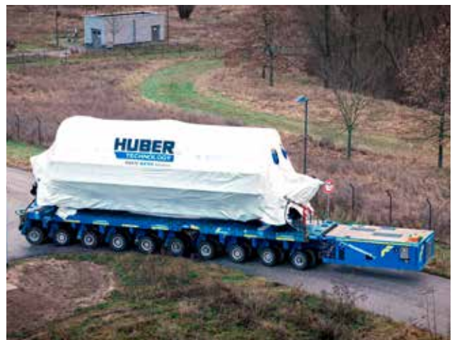
Transport eines Scheibentrockners zum Aufstellungsort.