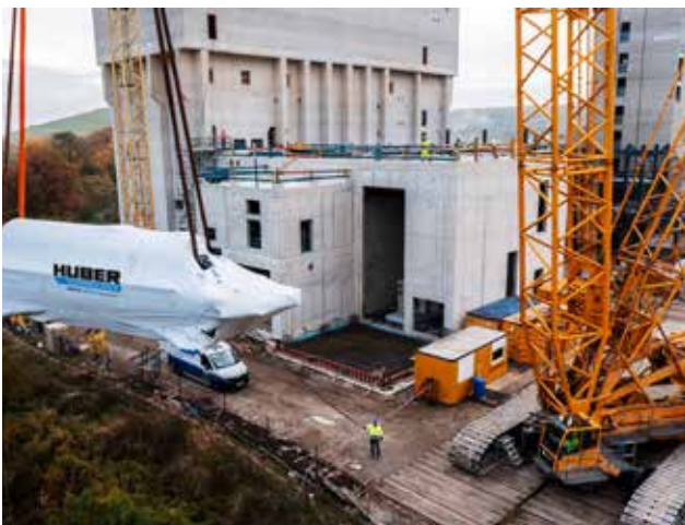
Einhub eines Scheibentrockners mit Schwerlastkran.