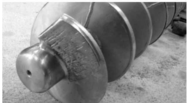
Fortgeschrittener Verschleiß an der Schneckenwelle.