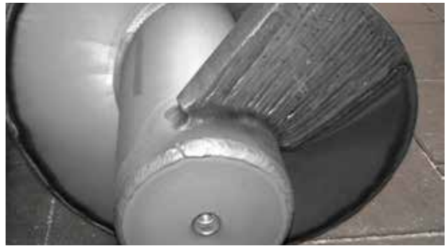
Neuwertiger Zustand der Schneckenwelle.

Haben Sie Interesse an der Nachrüstung der HUBER Waschpressen Verschleißerkennung? Dann kontaktieren Sie bitte den HUBER Global Service – eine Nachrüstung kann kostengünstig mit einem Wartungseinsatz verbunden werden.