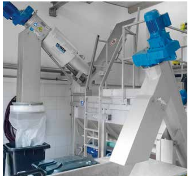
HUBER Kompaktanlage Hydro Duct ROTAMAT® Ro5 HD mit integriertem Sandwäscher.